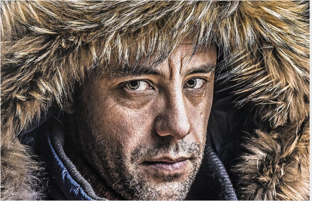
Tecnologia di risoluzione Ultra HD