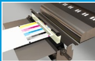
FWA (Full Width Array)

La funzione Allineamento automatizzato dell'immagine al supporto assicura un allineamento delle immagini e un registro da fronte a retro perfetti indipendentemente dal tipo o formato del supporto, facendovi risparmiare tempo ed eliminando onerosi sprechi dovuti a un registro scadente o alla distorsione dell'immagine.