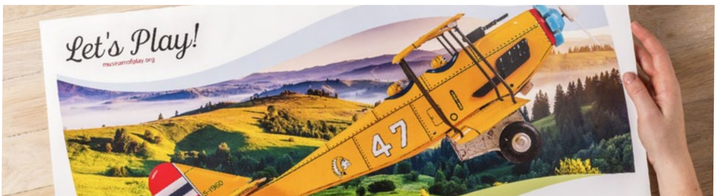
Stampa su fogli extra lunghi: formato massimo della carta 330,2 x 660 mm