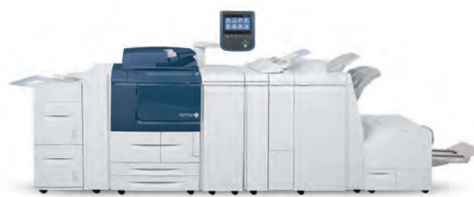
Copiatrice/stampante Xerox® D136, mostrata con alimentatore ad alta capacità a 2 vassoi opzionale, stazione di finitura standard, piegatrice e inseritore post-elaborazione.

Soluzioni di produzione innovative per salvaguardare l'ambiente oggi e in futuro.